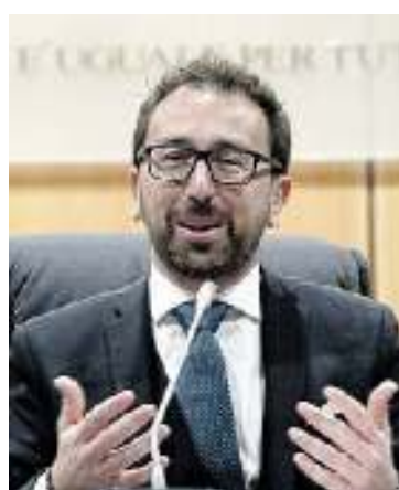
Il ministro della Giustizia Alfonso Bonafede

Destinatari dell'azione di classe sono le imprese ed enti gestori di servizi pubblici o di pubblica utilità (non la pubblica amministrazione). Il giudice competente è individuato nel cosiddetto «tribunale delle imprese». La procedura si articola in tre fasi: ammissibilità dell'azione, decisione sul merito, liquidazione delle somme dovute agli aderenti all'azione. Per quanto riguarda i tempi la riforma fissa in 30 giorni il termine entro il quale il tribunale deve decidere sull'ammissibilità dell'azione; la relativa ordinanza va pubblicata entro 15 giorni ed è reclamabile entro